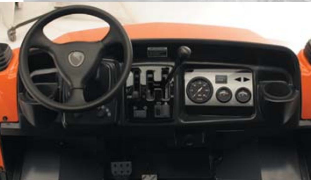
Tableau de bord à lecture rapide